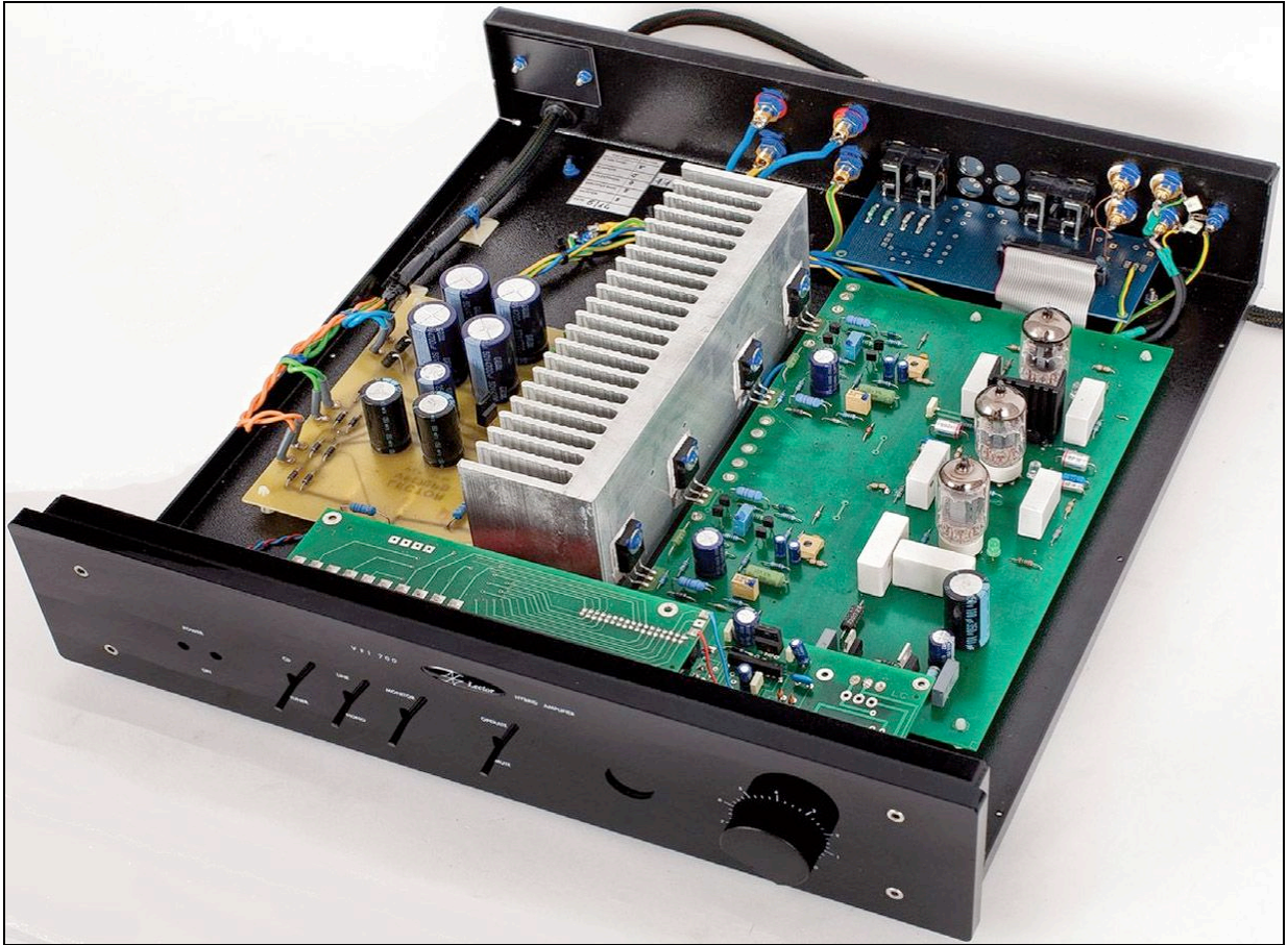
Vue interne du VFI-700 MM