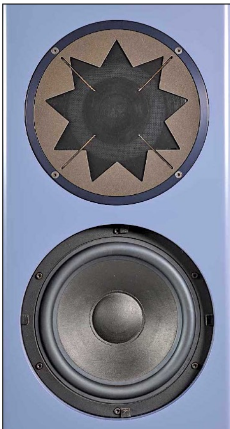
Haut-parleurs de façade MST et woofer.

Coffret dont les bord sont arrondis est disponible dans toutes les finitions vernies satinées ou laquées ultra-brillant des nuanciers RAL ou NCS.