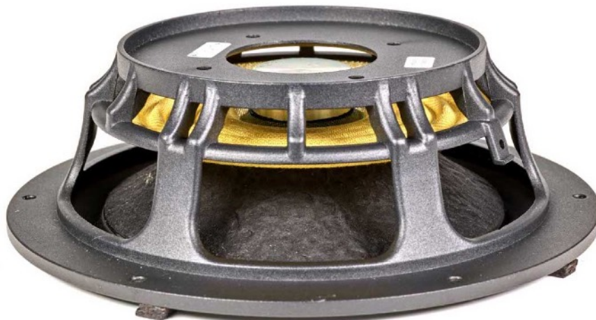
Détail du radiateur passif