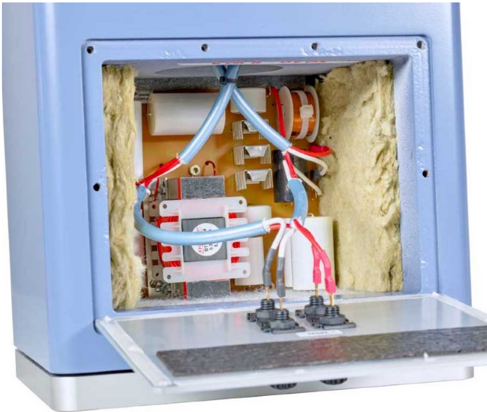
Filtre derrière la plaque du double bornier