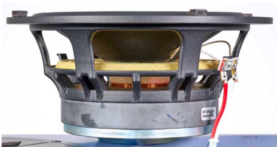
Détail du woofer

Finition personnalisable : toute couleur vernie ou laquée brillant des nuanciers RAL ou NCS