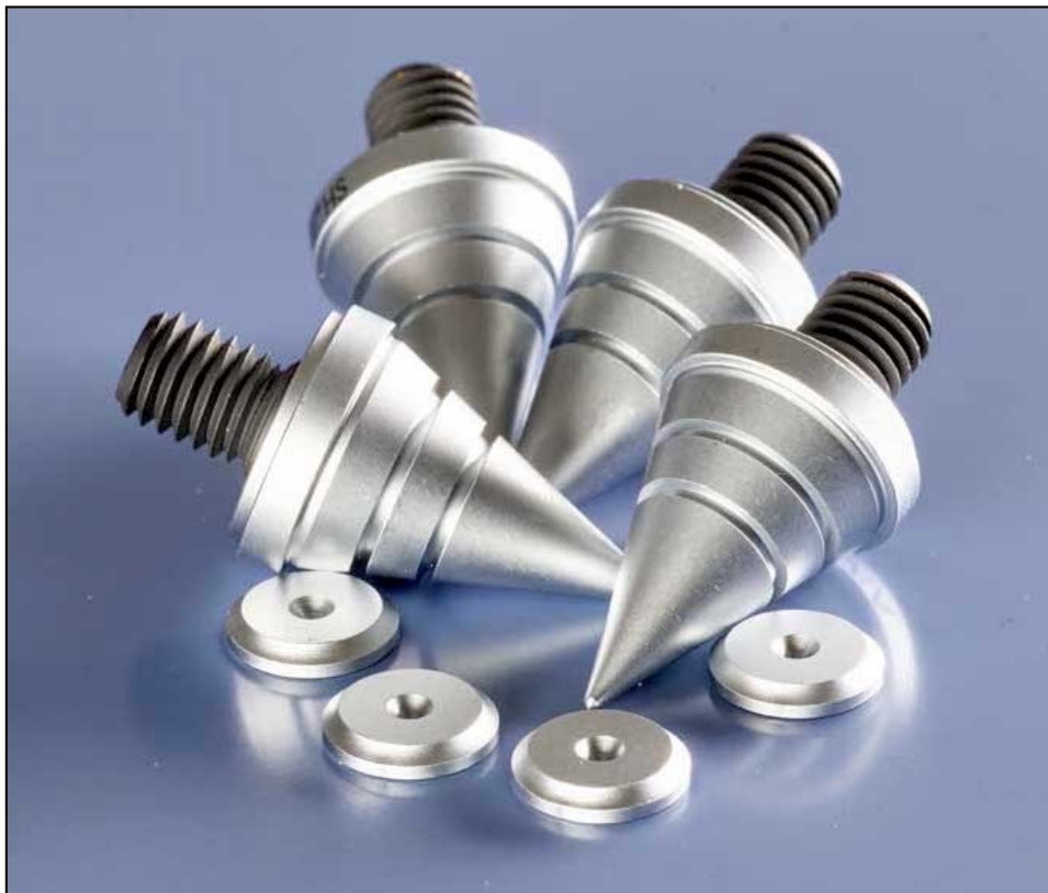
Jeu de pointes et contrepontes