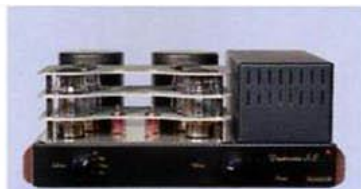
Image : Les caractéristiques de rapidité et de fougue du Due Trenta SE sont directement liées à la qualité tridimensionnelle de la scène sonore très stable proposée par l'intégré. La localisation des pupitres du Royal Philharmonic Orchestra interprétant la Symphonie n° 11 de Chostakovitch est millimétrique dans tous les plans. On voit lit-

appels transitoires des frappes de timbales ( Symphonie n° 11 de Chostakovitch écoutée à bon niveau) ne présentaient aucun manque en terme de rapidité sur les attaques et de niveau d'énergie instantanée ressentie. La lisibilité du message n'a aucunement souffert de ces demandes répétitives en courant, signe d'une osmose réussie entre les étages audio et l'alimentation du Mastersound.